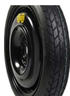
Koło dojazdowe (KOŁO)