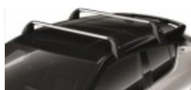
Bagażnik dachowy (do 75 kg) (PW301-10005)

Polecane akcesoria niewliczone do powyższej kalkulacji