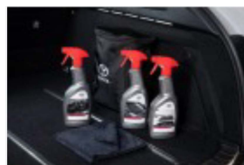
Zestaw kosmetyków samochodowych Toyota (PZWIG-OKIT1-00)