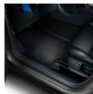
Dywaniki gumowe (2WD) (PW210-10006)