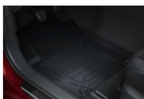
Dywaniki gumowe kpl

Polecane akcesoria niewliczone do powyższej kalkulacji