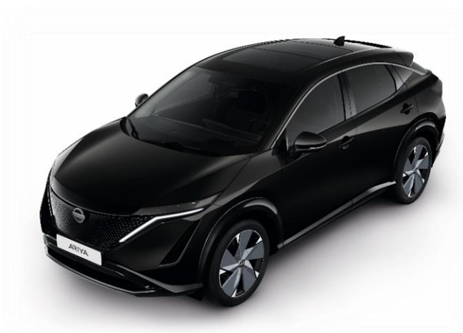
Czarny perłowy [GAT]

Lakier metalizowany / perłowy (jednokolorowe nadwozie) – 3 900 zł