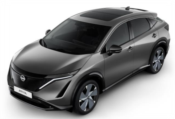
Szary metalizowany [KAD]