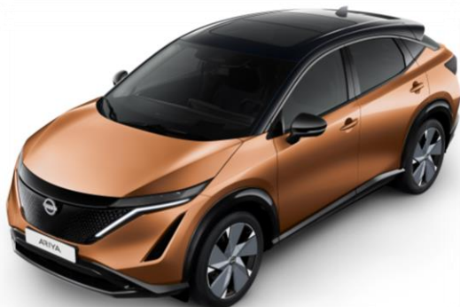
Miedziany metalizowany AKATSUKI + czarny dach i lusterka [XGJ]