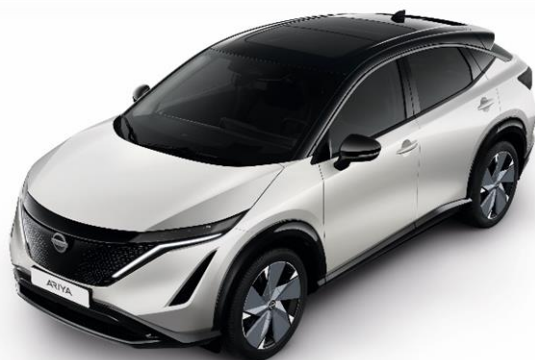
Biały perłowy + czarny dach i lusterka [XGA]