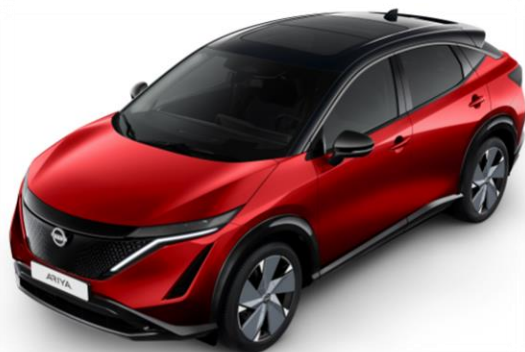
Czerwony metalizowany + czarny dach i lusterka [XGD]