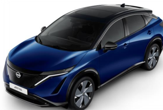
Niebieski perłowy + czarny dach i lusterka [XGU]