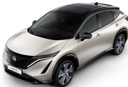
Srebrny metalizowany + czarny dach i lusterka [XCV]