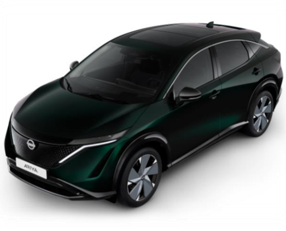
Zielony perłowy AURORA [DAP]