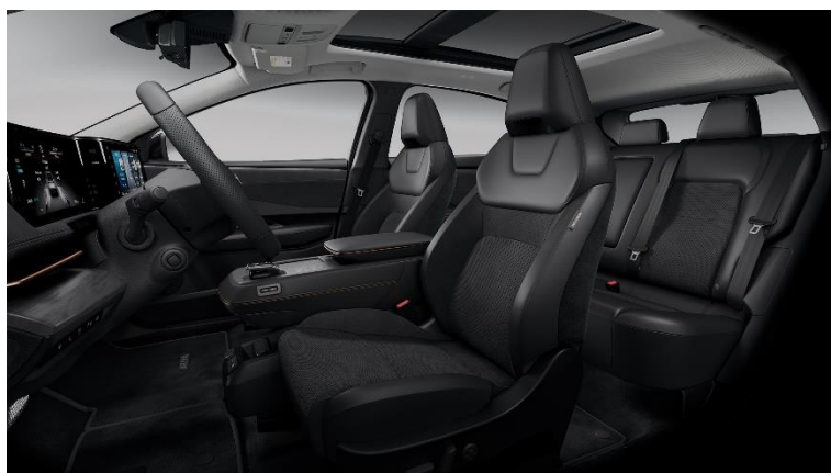
Czarna [G] (welur perforowany + częściowo skóra ekologiczna**)