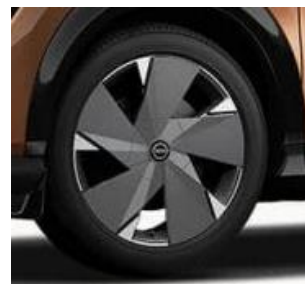
20" felgi ze stopu metali lekkich z nakładkami aerodynamicznymi (standard dla wersji e-4ORCE)