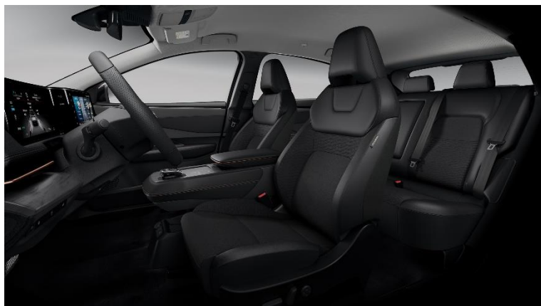
Czarna [G] (materiał + częściowo skóra ekologiczna**)