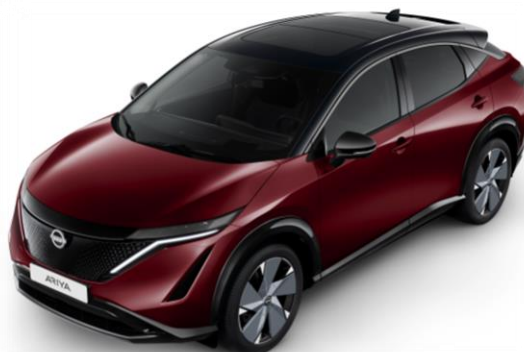
Burgundowy metalizowany + czarny dach i lusterka [XGG]