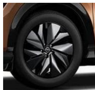
19" felgi ze stopu metali lekkich z nakładkami aerodynamicznymi (standard dla wersji 2WD)