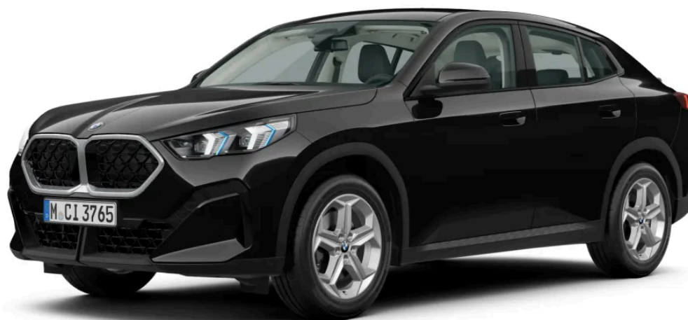
BMW X2 sDrive20i Linia podstawowa

BMW Financial Services oferuje opcje finansowania, które umożliwiają zakup nowego lub używanego pojazdu marki BMW. W każdym punkcie dealerskim BMW możesz zwrócić się do specjalisty BMW Financial Services, który z chęcią udzieli szczegółowych informacji o dostępnych opcjach finansowania.