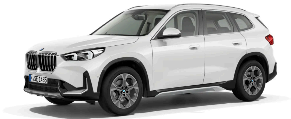
BMW X1 sDrive18i xLine