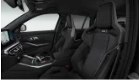
Podsufitka M Anthracite (S0775)