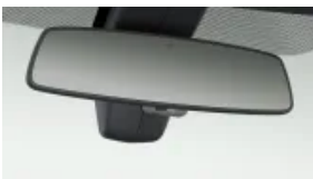
Lusterko wsteczne przyciemniane automatycznie (S0431)