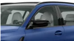
Pakiet dodatkowych funkcji lusterek (S0430)