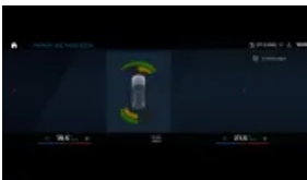
Czujniki parkowania z przodu i tyłu (S0508)