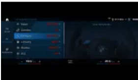
Zawieszenie adaptacyjne M (S02VF)