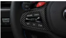
Regulator prędkości z funkcją hamowania (S0544)