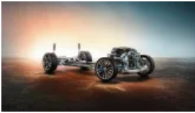
Sportowy dyferencjał M (S02T4)