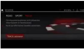
M Drive Professional (S01MB)