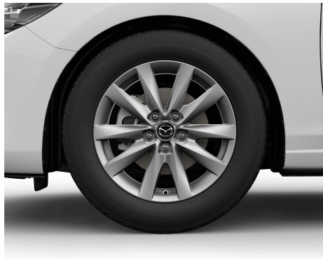
OBRĘCZE ALUMINIOWE 17 GUNMETAL (OPONY 225/55)