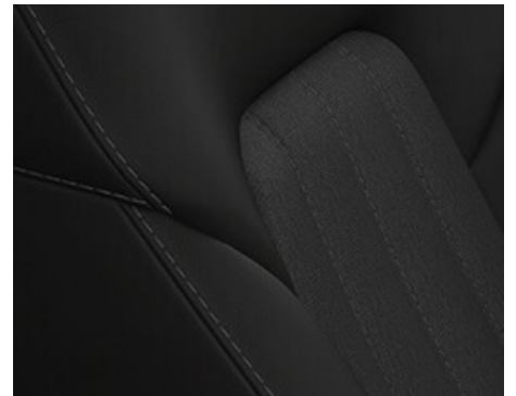
TAPICERKA MATERIAŁOWA STANDARD Z FUNKCJĄ PODGRZEWANYCH SIEDZEŃ