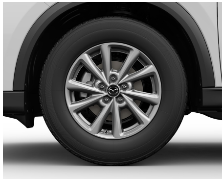
FELGI ALUMINIOWE (17) 225/65 W KOLORZE SILVER METALLIC