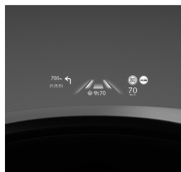
CZYSTA PRZYJEMNOŚĆ PROWADZENIA

Czysta przyjemność prowadzenia. Wnętrze każdego modelu Mazdy charakteryzuje szlachetny minimalizm, dlatego żadne dodatkowe bodźce nie rozpraszają uwagi kierowcy, który może w pełni skupić się na prowadzeniu i czerpać z niego maksimum przyjemności.