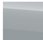
KOLOR LAKIERU: Silky Silver (ZCC)