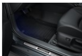
Dywaniki gumowe - kpl (PW210-02006)

Polecane akcesoria niewliczone do powyższej kalkulacji