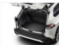
Listwa ochronna progu bagażnika (PC382-0A003)