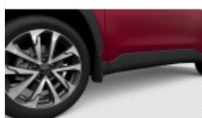
Chlapacze przednie i tylne (PW389-16000)

Polecane akcesoria niewliczone do powyższej kalkulacji