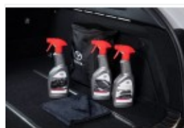
Zestaw kosmetyków samochodowych Toyoty (PZWIG-OKIT1-00)