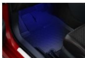
Dywaniki gumowe (PW210-0D033)