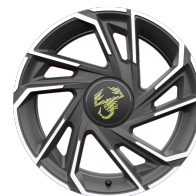
Felgi aluminiowe 18" w kolorze szarym matowym z diamentowym szlifem