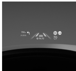
CZYSTA PRZYJEMNOŚĆ PROWADZENIA

Czysta przyjemność prowadzenia. Wnętrze każdego modelu Mazdy charakteryzuje szlachetny minimalizm, dlatego żadne dodatkowe bodźce nie rozpraszają uwagi kierowcy, który może w pełni skupić się na prowadzeniu i czerpać z niego maksimum przyjemności.