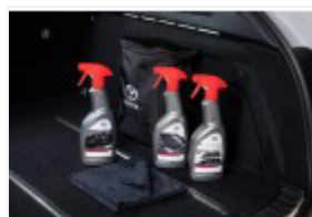
Zestaw kosmetyków samochodowych Toyoty (PZWIG-OKIT1-00)