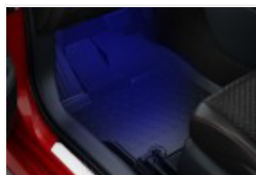
Dywaniki gumowe (PW210-0D033)

Polecane akcesoria niewliczone do powyższej kalkulacji